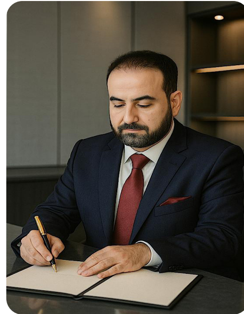
بقلّم :د. حسام البدري تمهيد

يظهر الاتحاد الأوروبي اليوم كقارة مسلّحة بالكلمات والبيانات أكثر من تسلّحه بالمدافع والصواريخ؛ يتحدّث عن "الاستقلال الإستراتيجي"، بينما يختبئ عملياً تحت مظلة الأميركية، ويُمَوِّل سباق تسلّح متأخراً ومشوشاً ينهش من لحم بنيته التحتية ورفاه مواطنيه. وفي المقابل يطل ترامب بخطة من ٢٨ بنداً لإنهاء الحرب في أوكرانيا، تهدّد، لو قُدِّر لها النجاح، بتقويض هذا "الحلم الأوروبي" في استمرار الحرب كذريعة للبقاء في السلطة وإعادة تشكيل القارة جيو-سياسياً.