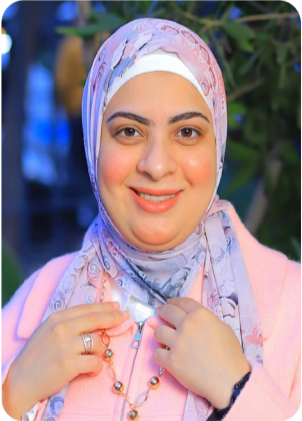
بقلم: هبة المنزلاوي

تبقى قيمة اللام بعد مواساة رب الوجود، ومكافاته لك على صبرك الطويل. - وفجر الله يهدينا، ويحيي الأمل فينا، فسار عوا إلى رحمة الله، ولذة الوقوف بين يديه. - لن ينجح أحد في إفساد سعادتك مادمت صاحب القرار. - سلام على من يتسهم في وجوه الناس، وقلبه يحترق من قسوة الآلام!! - شرف المرء عهده، فإن خان عهده، ضاع شرفه!! - إن وفقني الله يوماً ما، وحصلت على فرصتي، واستطعت أن أكون في موقع مسؤولية تجاهكم، كلمة شرف مني لكم أمام الله، سأكون صوتكم الحر النزيه، الذي يعبر عن قلبكم من نيران الهموم، وتجده معكم في كل خطوة بدمعك ويزيد من عزمك، ويسندك إن تعثرت قدمك، ويأخذ بيدك لو وقعت في الطريق، ولا يرتاح إلا بروية ابتسامتك. - الفتاة العفيفة تفوز باحترام المجتمع كله، ولكنها لا تعطي قلبها إلا لرجل واحد، يستطيع حمايتها في عالمه الخاص!! - الرجل الحنون مثل الماسة النادرة، لا تتكرر ولا يعوضها أحد. - ونور الله يطمئن قلوبنا، وينجينا من مأسائنا، ويمحننا الصبر على متاعب الأيام، ويبشّرنا بفرحة تعطر ليليانا. - وقتنا بالله نتعينا عن كل البشر، فمهما تنوقنا من مرارة الأيام وظلام النفوس، سنظل واقفين برووس شامخة وقلوب خاشعة، ننتظر عوض الله الجميل، فليس