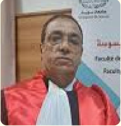
بقلم: د. نبيل العبيدي أستاذ القانون العام

ليست كل حرب قابلة للانتصار، حتى لو امتلك أحد أطرافها أقوى ترسانة عسكرية في العالم. فالسيادة، حين تتحول إلى عقيدة وطنية، لا تقاس بميزان الطائرات والصواريخ، بل بميزان الإرادة السياسية والعمق الشعبي والنشرعية الدولية.