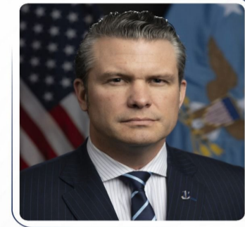
وزير الحرب الأمريكي

أكد رئيس الوزراء المكلف، علي فالح الزبيدي، وزير الحرب الأمريكي، هيغسيث، أهمية العمل على إعادة تفعيل التدريب لتعزيز قدرة القوات المسلحة العراقية ورفع مستوى كفاءتها. وذكر المكتب الإعلامي لرئيس مجلس الوزراء، في بيان أن «رئيس الوزراء المكلف، علي فالح الزبيدي، تلقى اتصالاً هاتفياً من وزير الحرب الأمريكي، بيت هيغسيث، هناك فيه بمناسبة تكليفه لتشكيل الحكومة الجديدة».