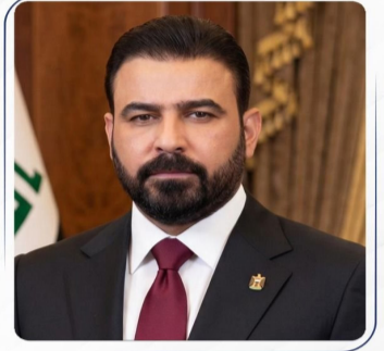
رئيس مجلس الوزراء المكلف